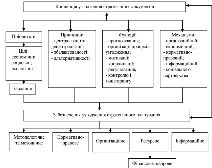
Рис. 1. Система узгодження стратегічного планування на національному, регіональному та місцевому рівнях

Необхідною умовою успішної управлінської діяльності є ефективний розподіл управлінських функцій, повноважень між регіоном й органами місцевого самоврядування.